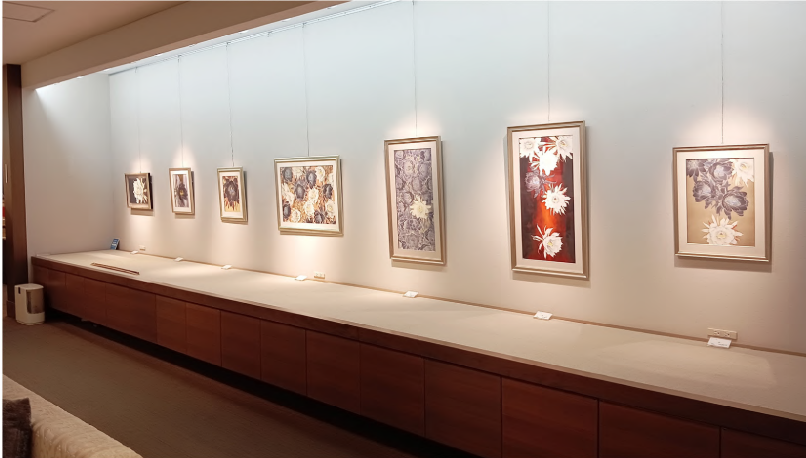
EXHIBITION VIEW Solo Exhibition, Hiroshima mMitsukoshi, Hiroshima, Japan (2025)