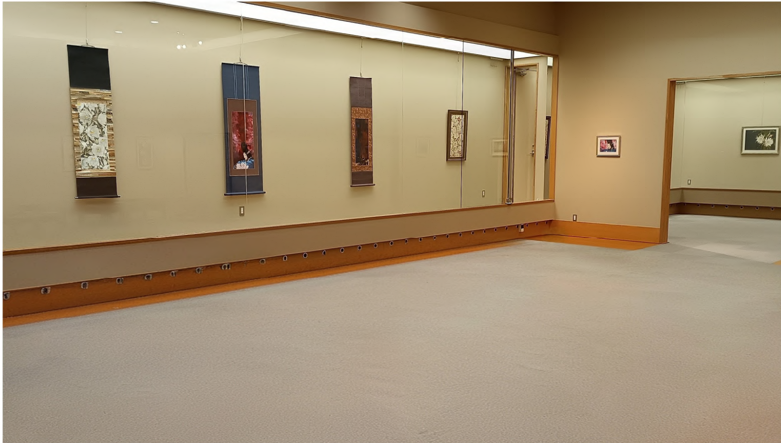
EXHIBITION VIEW Solo Exhibition, Art ai kisa, Hiroshima, Japan (2025)