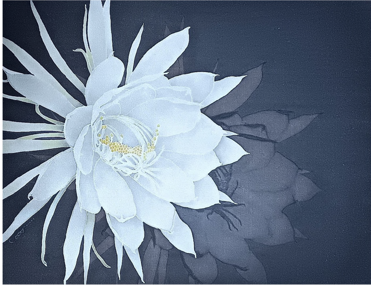
照・朧 / Glow / Haze 2026 絹本蠟纈染、染料 / Wax-resist dyeing on silk H294 × W410 mm