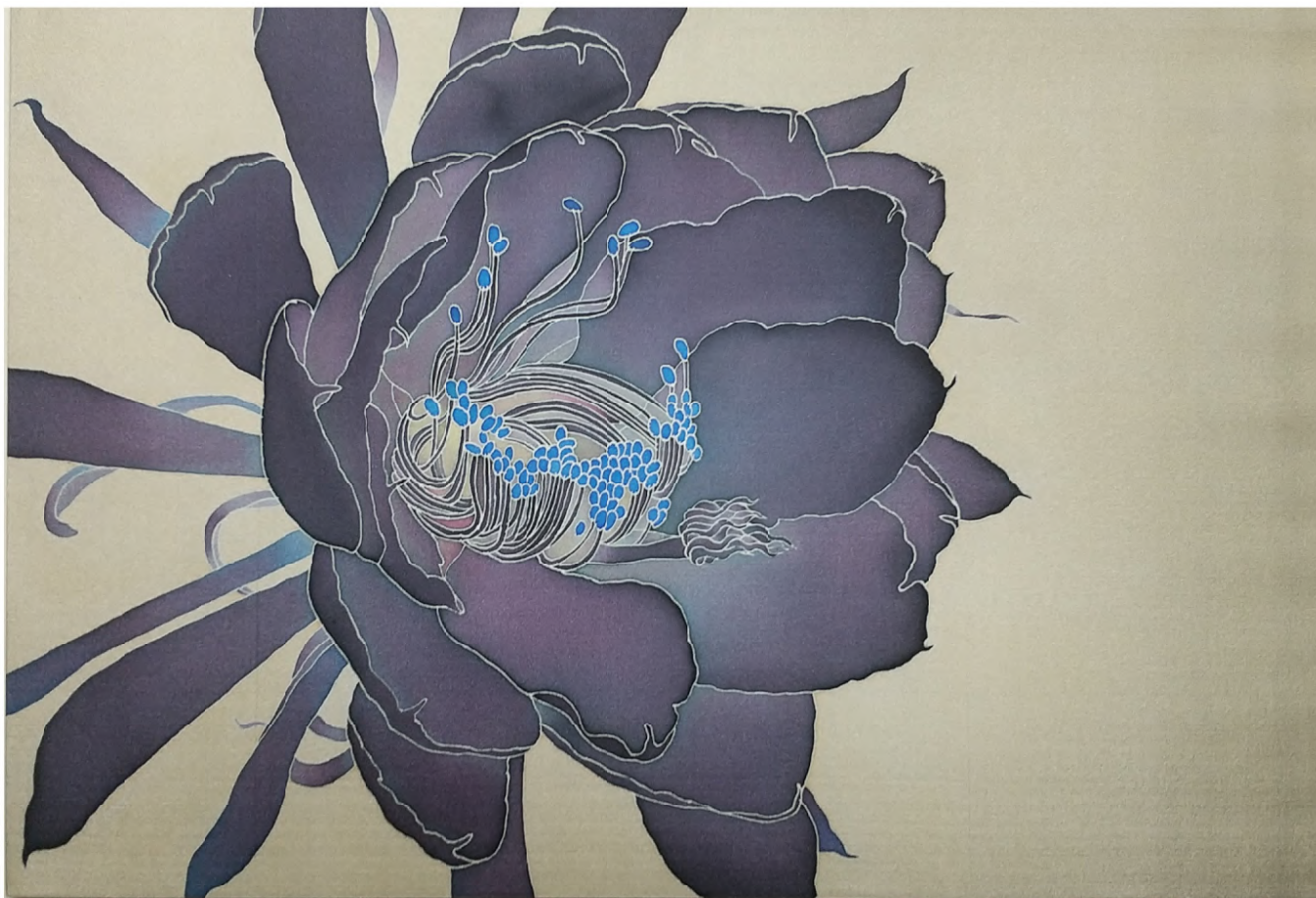
蝕/ Eclipse 2024 絹本蠟纈染、染料 / Wax-resist dyeing on silk H273 × W410 mm