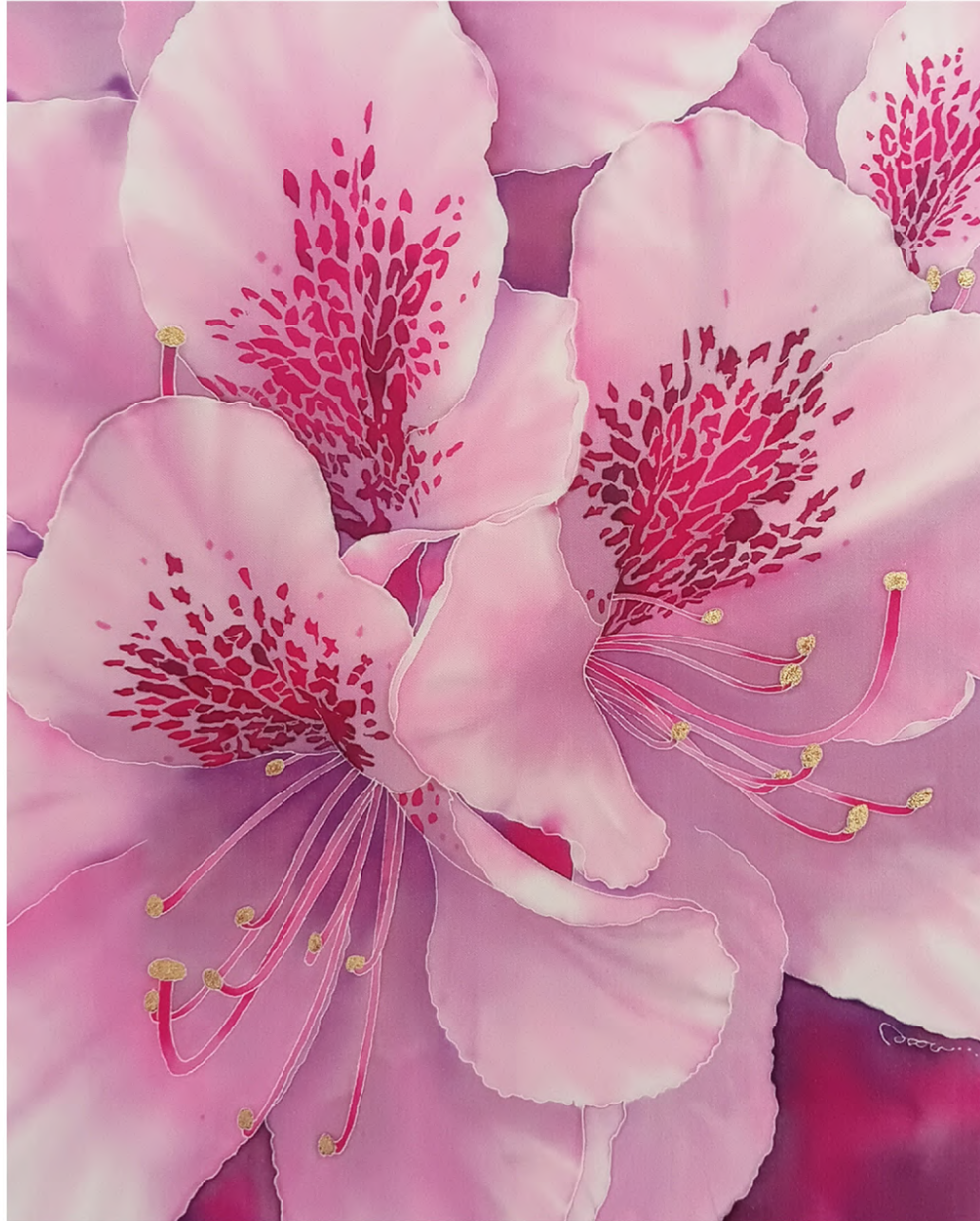
彩・躑躅/Colors•Azalea 2022 Wax-resist dyeing on silk H410× W294 mm