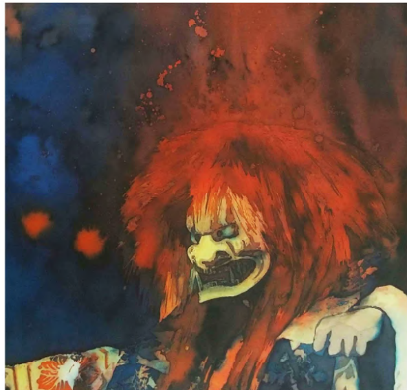
獅子王降誕/ The Birth of the Lion King 2024 Wax-resist dyeing on silk hanging scroll H750× W300mm