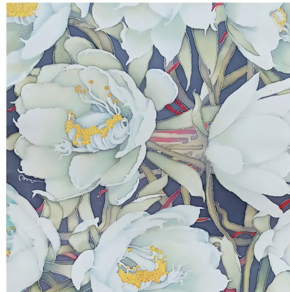
連#1/Sequence#1 2024 Wax-resist dyeing on silk hangin scroll H750× W300mm