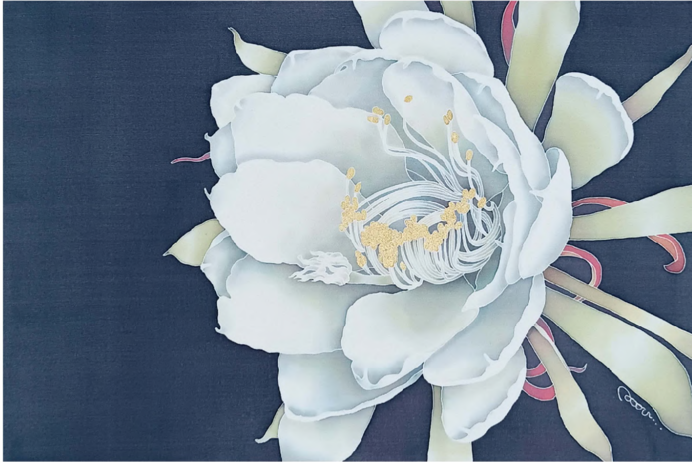
君、想フ / Thinking of You 2025 絹本蠟纈染、染料 / Wax-resist dyeing on silk H273 × W410 mm