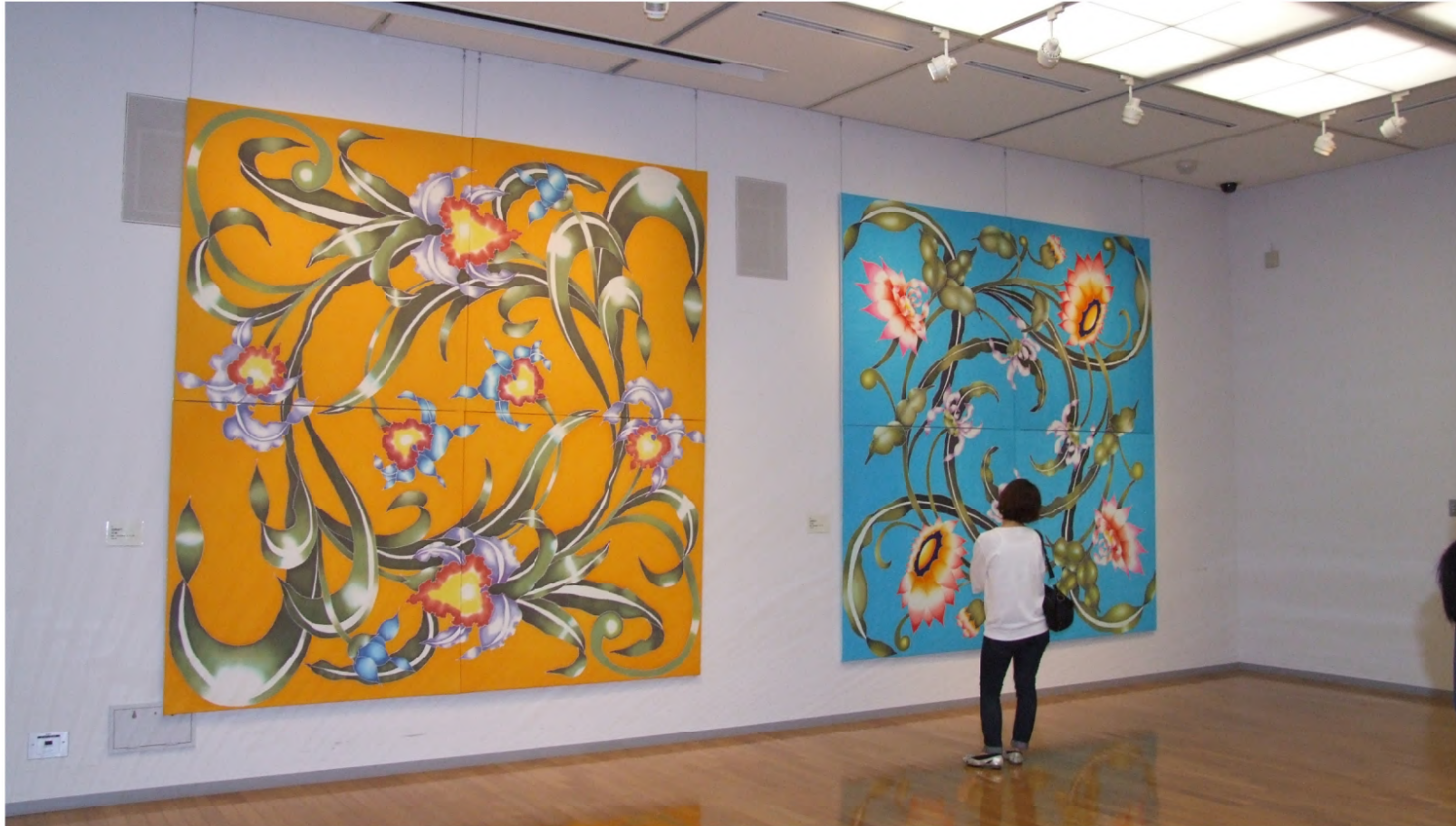
EXHIBITION VIEW Solo Exhibition, Hatsukaichi Art Gallery, Hatsukaichi, Japan (2008) Featured Series: Comma pattern